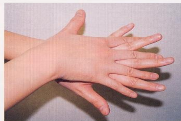
2. 手の甲を伸ばすように洗う